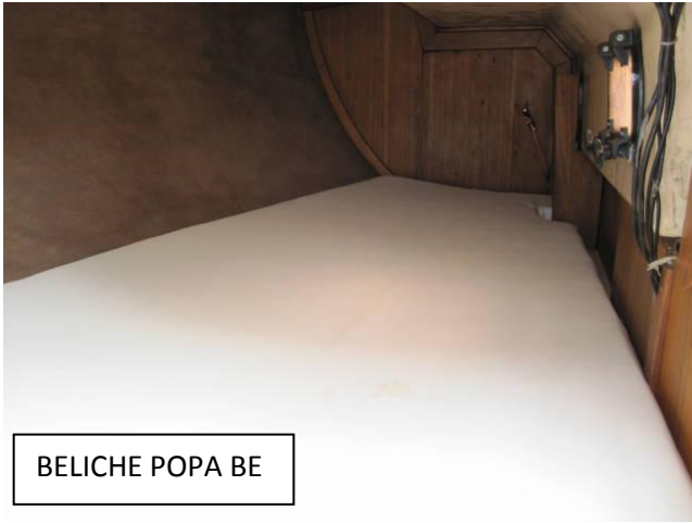
BELICHE POPA BE