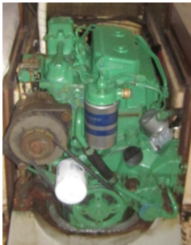
MOTOR VOLVO REVISADO, FILTROS E BOMBA DE COMBUSTÍVEL DIESEL NOVOS