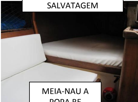
MEIA-NAU A POPA BE