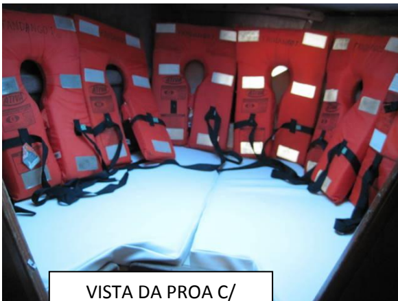
VISTA DA PROA C/ SALVATAGEM