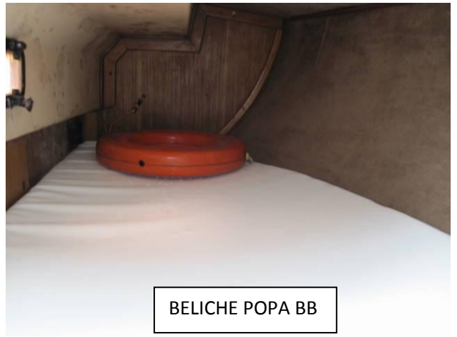
BELICHE POPA BB