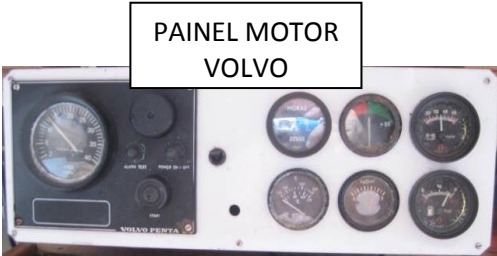
PAINEL MOTOR VOLVO