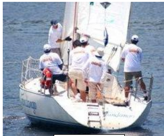
NO RJ, EQUIPE “BOTECO 1”