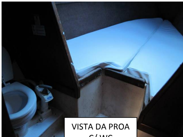
VISTA DA PROA C/ WC