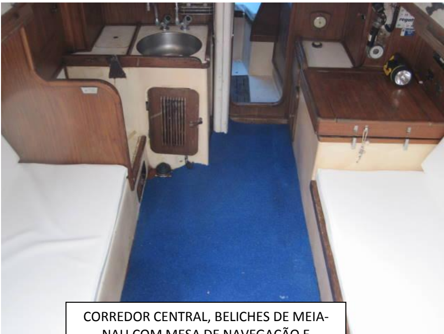
CORREDOR CENTRAL, BELICHES DE MEIA- NAU COM MESA DE NAVEGAÇÃO E GELADEIRA

VELAS: 3 balões, 3 mestras e 10 genoas e velas de proa!!